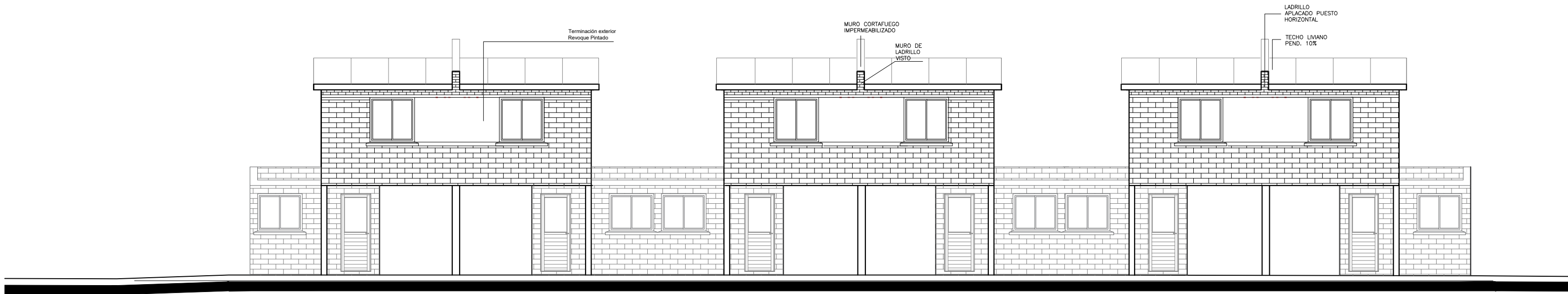
BLOQUE G- FACHADA POSTERIOR ESC. 1/100